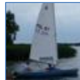
Jachty żaglowe typu Omega