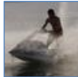
Skutery wodne (stojące)