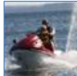
Skutery wodne (siedzące)